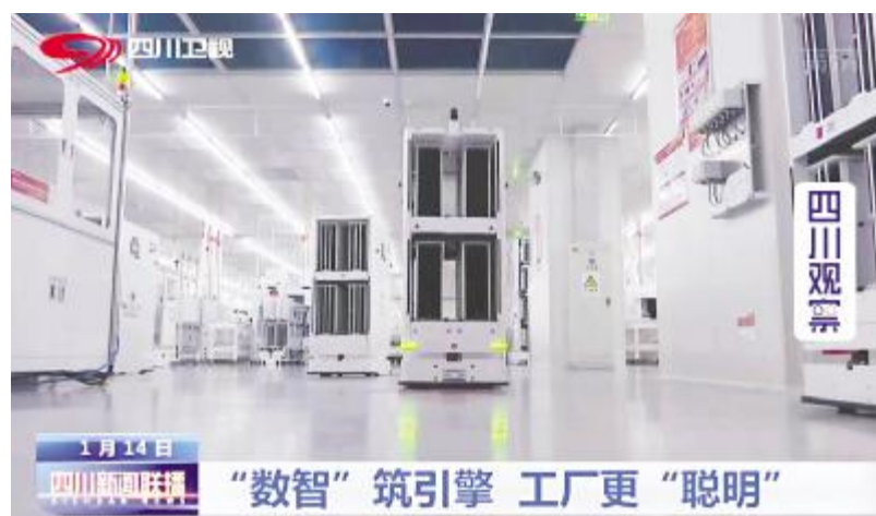
四川卫视《四川新闻联播》播出通威太阳能工厂画面

威太阳能有效带动产业链上下游企业生产恢复,受到中央电视台等主流媒体聚焦点赞,荣获“成都市抗击新冠肺炎疫情先进集体”荣誉称号。此次表彰是对新冠疫情以来通威抗疫防疫和复工复产工作的高度肯定。在错综复杂的国际国内经济形势下,在经济社会转型升级的关键阶段,通威将继续锐意进取、真抓实干,为加快体现新发展理念的城市建设、促进经济社会高质量发展做出新贡献!