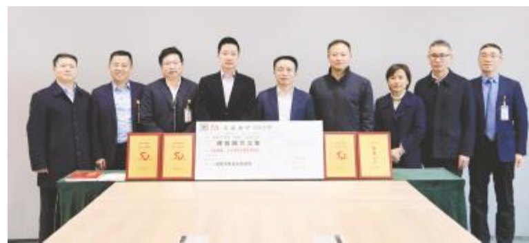
鲜荣生书记为通威太阳能成都基地颁授奖牌

座谈中,鲜荣生书记介绍了全区发展情况及未来发展规划,并现场办公解决公司关心问题。鲜荣生书记表示,双流持续优化营商环境,为企业提供个性化定制服务,实现“解决一个诉求、形成一套制度、破解一类问题”,从根本上为企业排忧解难。通威作为成都本土真正原创力工业企业,希望公司坚持科技创新,在“十四五”期间一如既往地支持双流发展,政企双方继续优化沟通机制,在更广领域、更深层次开