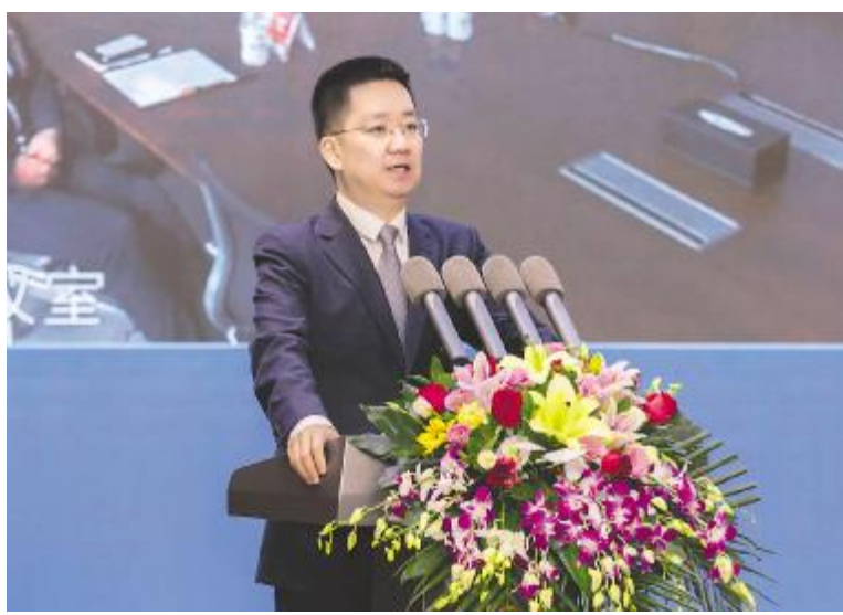
谢毅董事长在通威太阳能2020年度厂长述职会上讲话

竞争力是“人”,期望2021年采购全员在以下能力方面突破质的飞跃。加强解决问题和推动问题解决的能力,有前瞻性、计划性,面对可能出现的问题提前做好预处理方案,经验的传承和创造性不可或缺;高度责任心,对自己的工作领域内容了如指掌,有足够的把握能力和把控能力;坚守正确价值观,放平工作态度,凸显采购价值“确保供应,持续降本”;坚持采购原则,坚守采购底线,坚决不碰采购红线,风清气正从一而终;采购团队每一个人要有主人翁意识,提高工作主动性,采购是一个团队,抛开事不关己的态度,让找到采购的每一件事情都能顺利过渡。2021年,采购团队将继续发挥光和热,以公司利益为主,为公司的发展贡献力量。