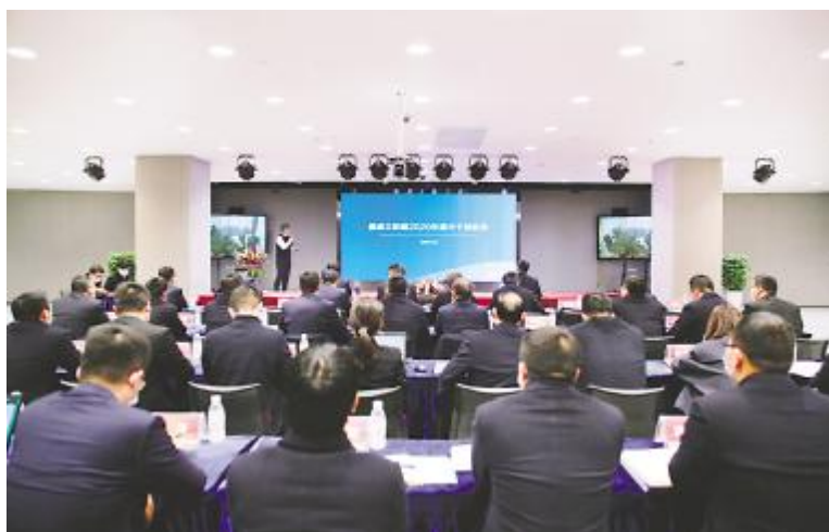
成都基地中干年终述职会现场