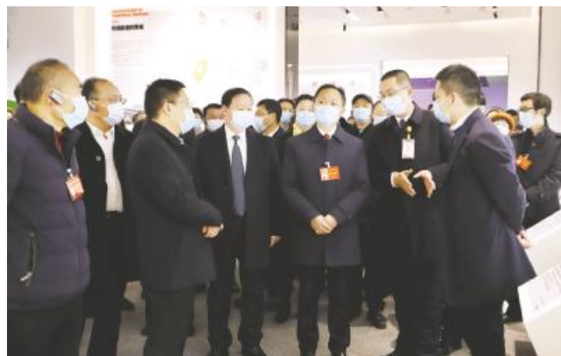
眉山市两会代表团参观通威太阳能智能制造体验中心

参观过程中,代表团与公司相关负责人亲切交谈,就光伏行业发展前景及眉山基地发展现状进行深入交流,并表示,通威稳健、快速发展,辉煌成绩令人钦佩,希望通威太阳能继续保持优势,创造更大行业价值,助推行业健康可持续发展。