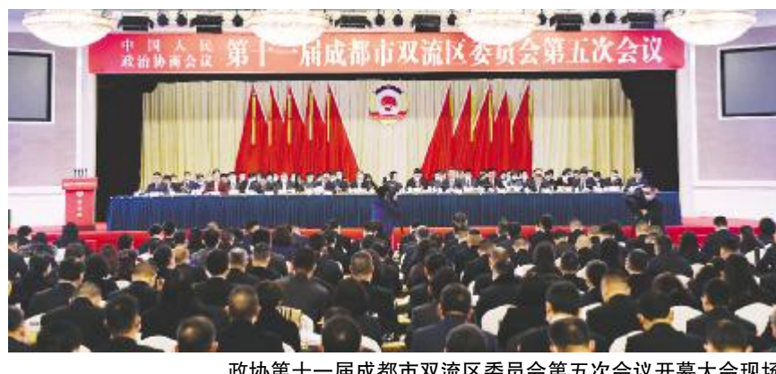
政协第十一届成都市双流区委员会第五次会议开幕大会现场

流的时代价值,加速攻坚城市功能品质提升。要以建设践行新发展理念的航空经济之都为统揽,努力把双流打造成为新时代企业最容易做生意的地方,市民获得感、幸福感、安全感增长最快的地方,干部人才心齐气顺、只争一流的地方!希望区政协在“十四五”期间一如既往地支持双流发展,最大限度增进理解、凝聚共识,为重塑双流荣光画出最大的同心圆,凝聚最大的正能量!