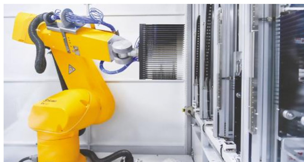
通威太阳能智能制造生产线机械臂

和行业媒体高度关注。2020 年初,通威太阳能防疫和生产两手抓、两不误,有序组织复工复产,央视新闻《共同战“疫”》在双流基地现场直播 33 分钟。此后,通威太阳能接连启动多个重大项目,从四川省乃至全国首批复工复产企业,迅速转变为首批稳产、满产和首批新项目开工企业。3月25日,通威太阳能金堂光伏产业基地项目开工,总投资 200 亿,启动建设 30GW 高效晶硅电池及配套项目;4月21日,通威太阳能眉山基地一期高效晶硅电池项目投产二期项目开工,打造全球智能化程度最高、量产转换效率最高、节能环保的绿色工厂。通威太阳能的发展战略和高效执行受到了人民网、新华社、四川日报、黑鹰光伏、华夏能源网等媒体的高度赞誉,点赞项目为光伏产业发展、成渝经济圈高质量发展提供了重要产业支撑。