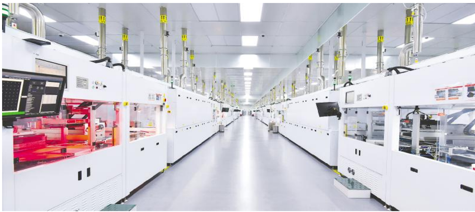
通威太阳能智能制造生产车间