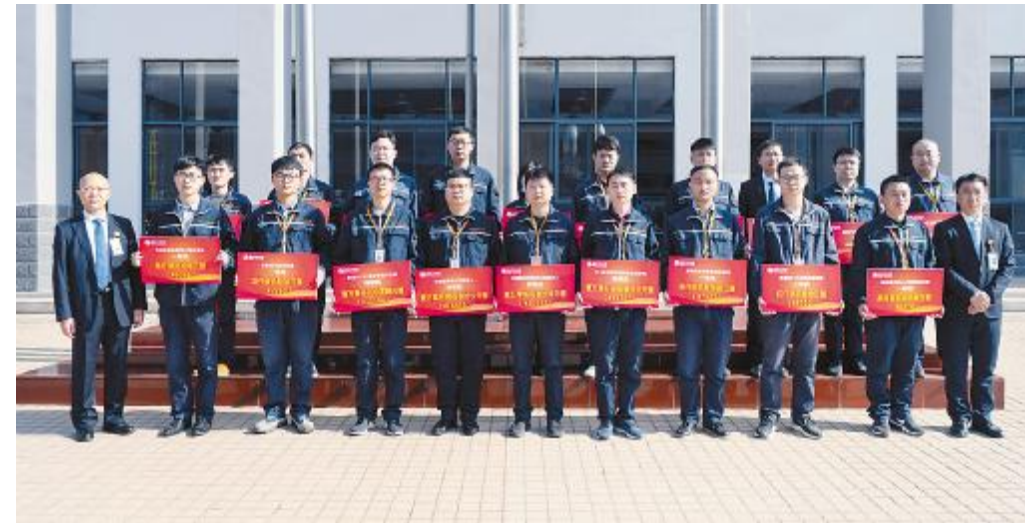
合肥基地2021年第一季度TQM颁奖仪式合影留念