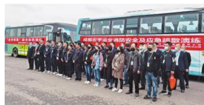
眉山基地开展应急救援和消防演练

灭火器目的。随后,在模拟车辆起火的情况下,参训人员进行应急疏散,全员迅速高效撤离到安全地带,演练效果良好。 此外,授课老师还向参训人员讲授和演示了心肺复苏术的正确操作流程,让大家熟练掌握应急救援方法。同时,考虑到很多员工只会开车不会检查车况,为了保障大家在日常用车和节假日自驾游的行车安全,特意通过寓教于乐的方式安排了私家车日常维护、常见故障排查及应对措施教学。