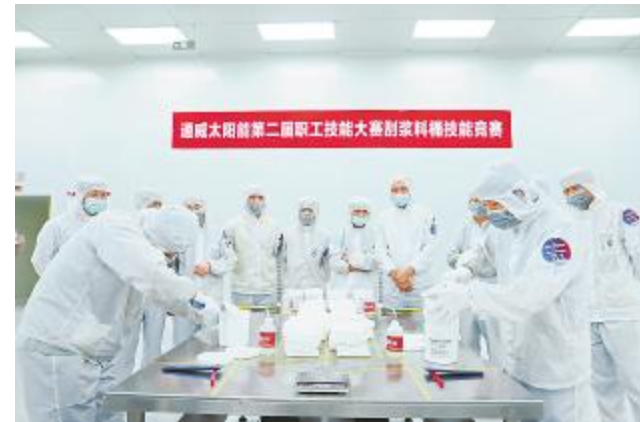
刮浆料桶技能竞赛现场