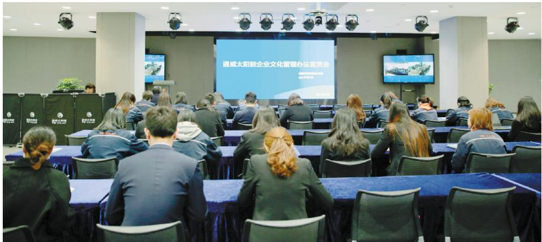
通威太阳能企业文化宣贯会现场

文化宣贯是一个长期持续的过程,让企业文化内涵植入人心,内化为每一位员工的行为准则,进一步转化为企业发展的不竭动力,是我们的不懈奋斗目标。未来,通威太阳能将不断创新工作思路,采取行之有效的宣贯手段,大力宣贯公司文化理念,推动企业文化建设再上新台阶。