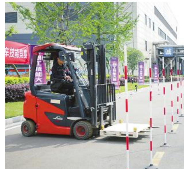
叉车技能竞赛现场

本报讯(记者 唐胜 通讯员 程良 张涛 徐忠琴)4月8日-15日,通威太阳能为期一周的第二届职工技能大赛成功举办,本次比赛以“赛技能亮点,展岗位风采”为主题,合肥、双流、眉山三地共计250余名选手积极报名参加比赛,经过叉车、刮浆料桶、电工、电池片检验、消防共五个技能项目的激烈角逐,最终产生了单项冠军、亚军和季军各五名。 此次技能大赛以搭建平台、发掘人才和培养队伍为主旨,以行业技师等级测试水平为标准,对选手的综合实力进行了全面考量。比赛现场,活动道旗随风飘扬,工作人员准备物料、调试设备,员工们高度集