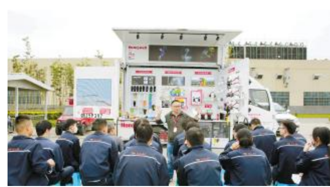
双流基地劳保防护用品使用培训现场