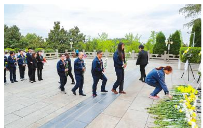
党员们为烈士敬献鲜花

通过此次祭扫活动,深切的缅怀了革命先烈,重温了爱国主义精神,强化了党委的凝聚力。党员们纷纷表示,一定要继承前辈的革命传统,将爱国之情、报国之志转化为奋斗之举,立足本职岗位贡献智慧、奉献力量,为公司高质量发展做出一份贡献。