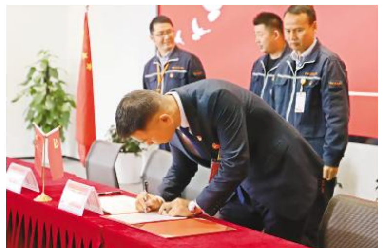
眉山基地百日奋战责任状签订仪式现场