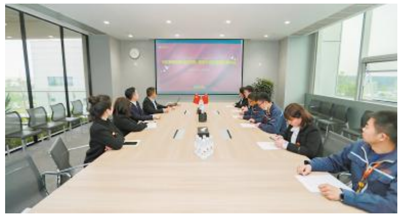
双流基地百日奋战责任状签订仪式现场