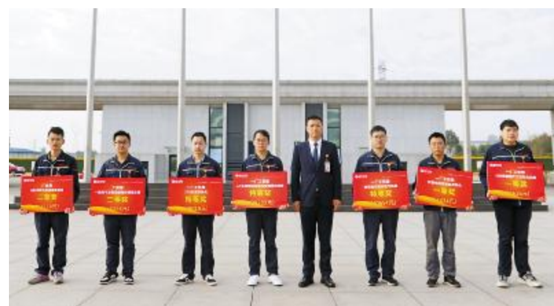
眉山基地2021年第一季度TQM颁奖仪式合影留念

2021年第一季度,合肥基地表彰优秀TQM提案224项,年收益约7443.02万元;双流基地表彰优秀TQM提案76项,年收益约3339.65万元;眉山基地表彰优秀TQM提案47项,年收益约2574.63万元。