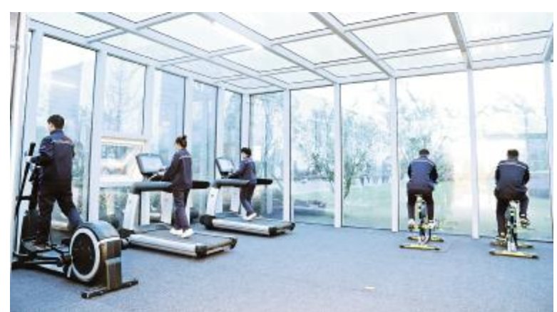
眉山基地党工阵地宽敞明亮的健身房