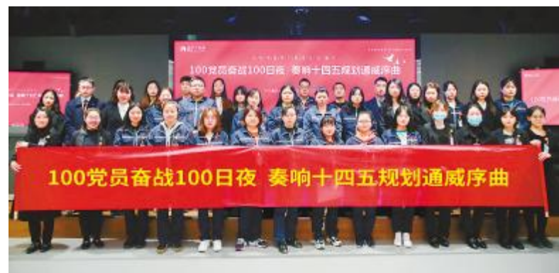
双流基地合影留念