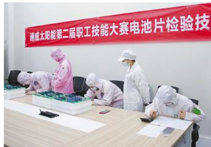
电池片检验技术竞赛现场