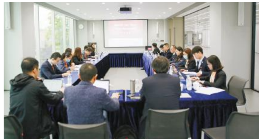
双流基地2021年两化融合管理体系监督评审会议现场

本次审核将为今年TüV莱茵的第三方外审奠定基础,也是践行公司质量方针和目标的着手点,通威太阳能将以此为契机,提升整体管理水平,提升产品质量和市场竞争能力,助推公司生产经营高效运转。