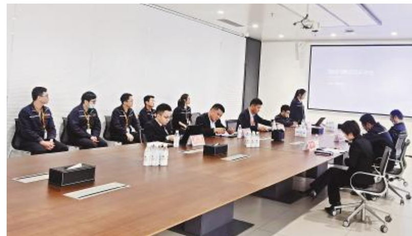
眉山基地2021年第一季度TQM评审会议现场