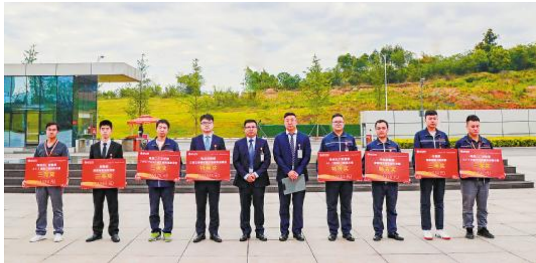
双流基地2021年第一季度TQM颁奖仪式合影留念