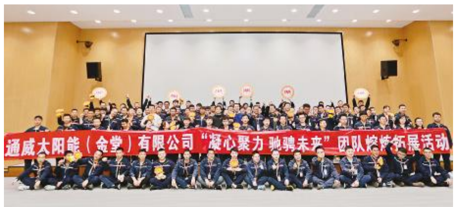
金堂基地“凝心聚力,驰骋未来”团队熔炼拓展活动合影留念

堂基地作为通威太阳能目前规模最大、产品最新、技术最新、智能化程度最高的基地,要在最短的时间打造5G+先进制造业典范,助力公司“为了生活更美好”愿景达成,需要所有通威人戮力同心,朝着通威“追求卓越,奉献社会”的企业宗旨持续奋斗。