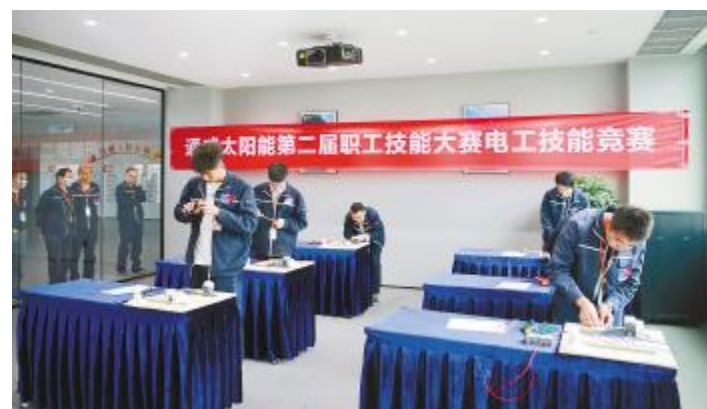
电工技能竞赛现场